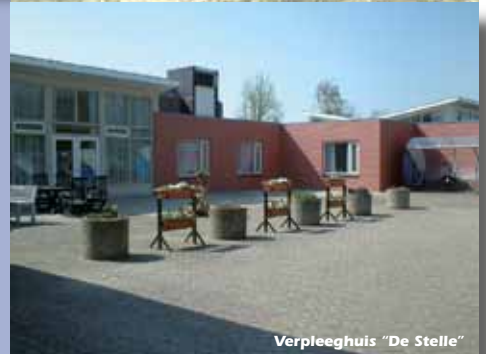
Verpleeghuis "De Stelle"

Postbus 172, 4500 AD Oostburg E-mail: info@woonzorgwzv.nl Internet: www.woonzorgwzv.nl