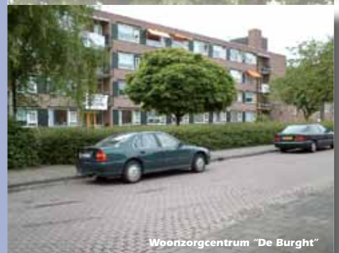
Woonzorgcentrum "De Burght"