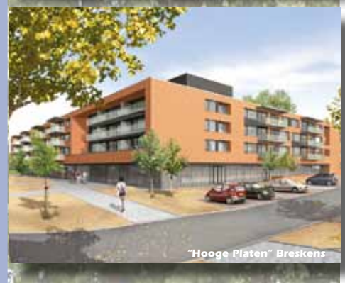
"Hooge Platen" Breskens