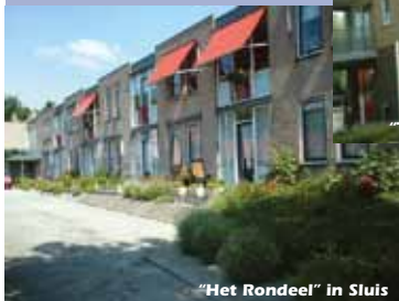
"Het Rondeel" in Sluis