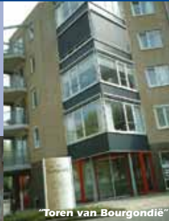
"Toren van Bourgondië"